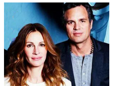
2015 THE NORMAL HEART (The Normal Heart) de Ryan Murphy avec Mark Ruffalo