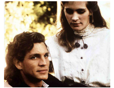
1989 UN FUSIL POUR L'HONNEUR (Blod Red) de Peter Masterson avec Eric Roberts