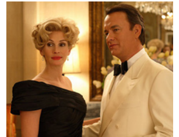
2008 LA GUERRE SELON CHARLIE WILSON (Charlie Wilson's War) de M. Nichols avec Tom Hanks