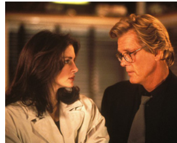
1994 LES COMPLICES (I love Trouble) de Charles Shyer avec Nick Nolte