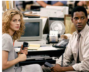
1993 L'AFFAIRE PÉLICAN (The Pelican Bride) d'Alan J. Pakula avec Denzel Washington