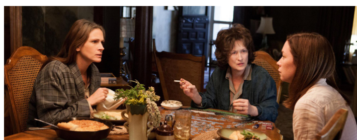
2014 UN ÉTÉ À OSAGE COUNTY (August : Osage County) de John Wells avec Meryl Streep, Julianne Nicholson