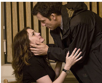
2009 DUPLICITY (Duplicity) de Tony Gilroy avec Clive Owen