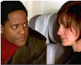
2002 FULL FRONTAL (Full Frontal) de Steven Soderbergh avec Blair Underwood