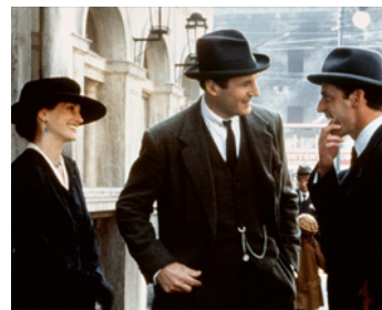
1996 MICHAEL COLLINS (Michael Collins) de Neil Jordan avec Liam Neeson, Aidan Quinn