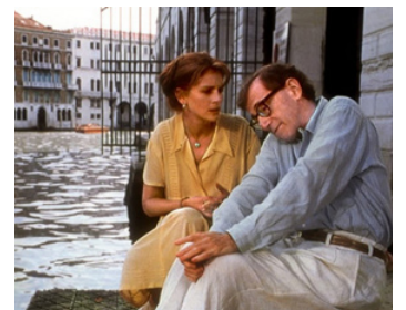
1996 TOUT LE MONDE DIT I LOVE YOU (Everone says I love you) de Woody Allen