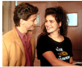
1988 MYSTIC PIZZA (Mystic Pizza) de Donald Petrie avec Adam Storke