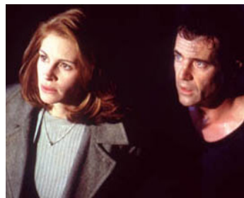
1997 COMPLOTS (Conspiracy Theory) de Richard Donner avec Mel Gibson