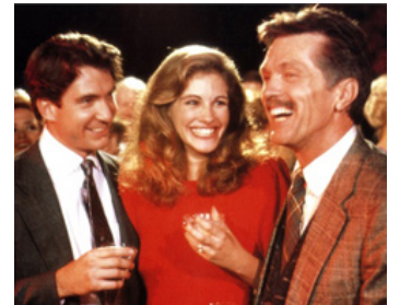
1994 PRÊT-À-PORTER (Pret-a-Porter) de Robert Altman avec Dylan McDermott, Tom Skerritt