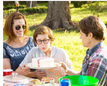
2008 FIREFLIES IN THE GARDEN de Dennis Lee avec Cayden Boyd, Willem Dafoe