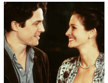
1999 COUP DE FOUUDRE À NOTTING HILL (Notting Hill) de Roger Michell avec Hugh Grant