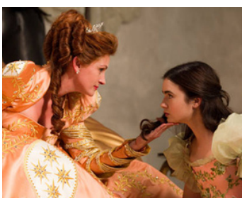
2012 BLANCHE NEIGE (Mirror, Mirror) de Tarsem Singh avec Lily Collins