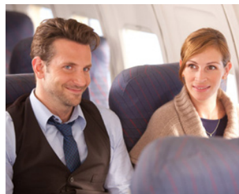
2010 VALENTINE'S DAY (Valentine's Day) de Garry Marshall avec Bradley Cooper