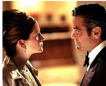
2004 OCEAN'S TWELVE (Ocean's Twelve) de Steven Soderbergh avec George Clooney