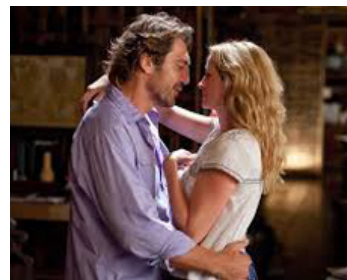
2010 MANGE, PRIE, AIME (Eat, Pray, Love) de Ryan Murphy avec Javier Bardem