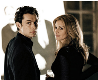
2004 CLOSER, ENTRE ADULTES CONSENTANTS (Closer) de Mike Nichols avec Jude Law