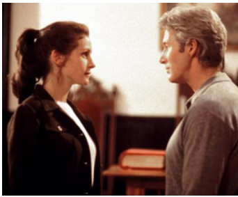
1999 JUST MARRIED (OU PRESQUE) (Runaway Bride) de Garry Marshall avec Richard Gere