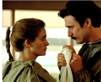
1991 LES NUITS AVEC MON ENNEMI (Sleeping with the Enemy) de J. Ruben avec Patrick Bergin