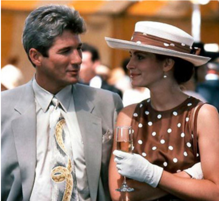
1990 PRETTY WOMAN (Pretty Woman) de Garry Marshall avec Richard Gere