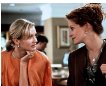
1997 LE MARIAGE DE MON MEILLEUR AMI (My best Friend's Wedding) de P. J. Hogan avec C. Diaz