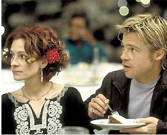
2001 LE MEXICAIN (The Mexican) de Gore Verbinski avec Brad Pitt