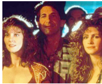
1988 BAJA OKLAHOMA de Bobby Roth avec Lesley Ann Warren, Peter Coyotte