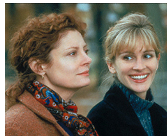
1998 MA MEILLEURE ENNEMIE (Stepmom) de Chris Columbus avec Susan Sarandon