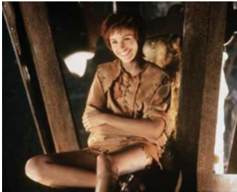
1991 HOOK ou La Revanche du Capitaine Crochet (Hook) de Steven Spielberg