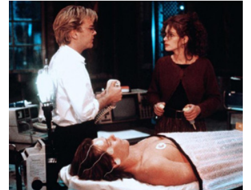
1990 L'EXPÉRIENCE INTERDITE (Flatliners) de J. Schumacher avec Kiefer Sutherland, K. Bacon