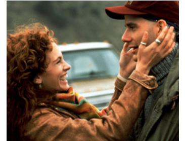
1991 LE CHOIX D'AIMER (Dying Young) de Joel Schumacher avec Campbell Scott