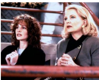
1995 AMOURS ET MENSONGES (Something to talk about) de L. Hallström avec G. Rowlands