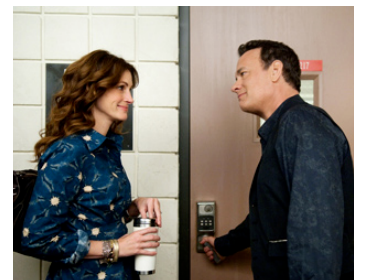
2011 IL N'EST JAMAIS TROP TARD (Larry Crowne) de et avec Tom Hanks