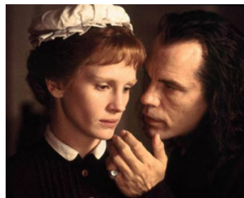
1996 MARY REILLY (Mary Reilly) de Stephen Frears avec John Malkovich