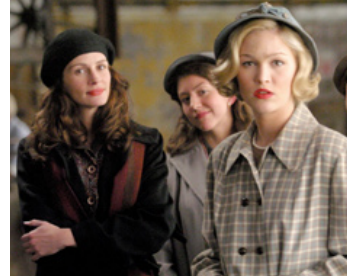
2003 LE SOURIRE DE MONA LISA (Mona Lisa Smile) de Mike Newell avec Kirsten Dunst