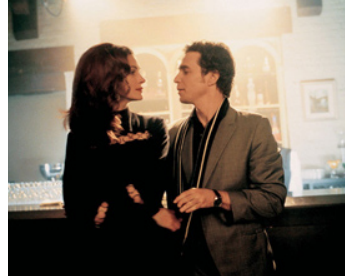
2002 CONFESSIONS D'UN HOMME DANGEREUX de George Clooney avec Sam Rockwell